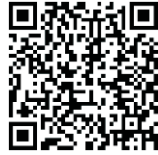
上海国际酒店及餐饮业博览会线上登记系统

（1）提供上海国际酒店及餐饮业博览会专属的“浙江省饭店业协会特邀嘉宾 VIP”胸卡（蓝卡）。会员代表需通过手机扫描二维码进行实名注册，获得电子参观证。请务必携带胸卡、“随申码”以及身份证原件进入展会现场（微信/支付宝—随申办—上海随申码）。