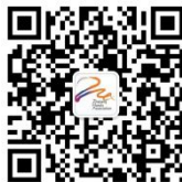
浙江省饭店业协会微信二维码